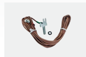
Kit sonde de température