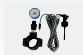
Kit détecteur de débit