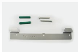
Kit fixation murale