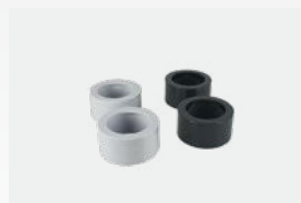
Kit réducteurs à coller